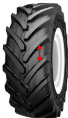
Figure 6.1.1 shows what type of tread is considered a tractor tire.

Joonis 6.1.1 – Rehvi loetakse traktorirehviks, kui kalasabamuustriga rehvi mustriklotside vahe ületab 50mm. Mustriklotside vahelises alas liimitud või muul viisil kinnitatud vaheklotse ei loeta mustriklotsideks.